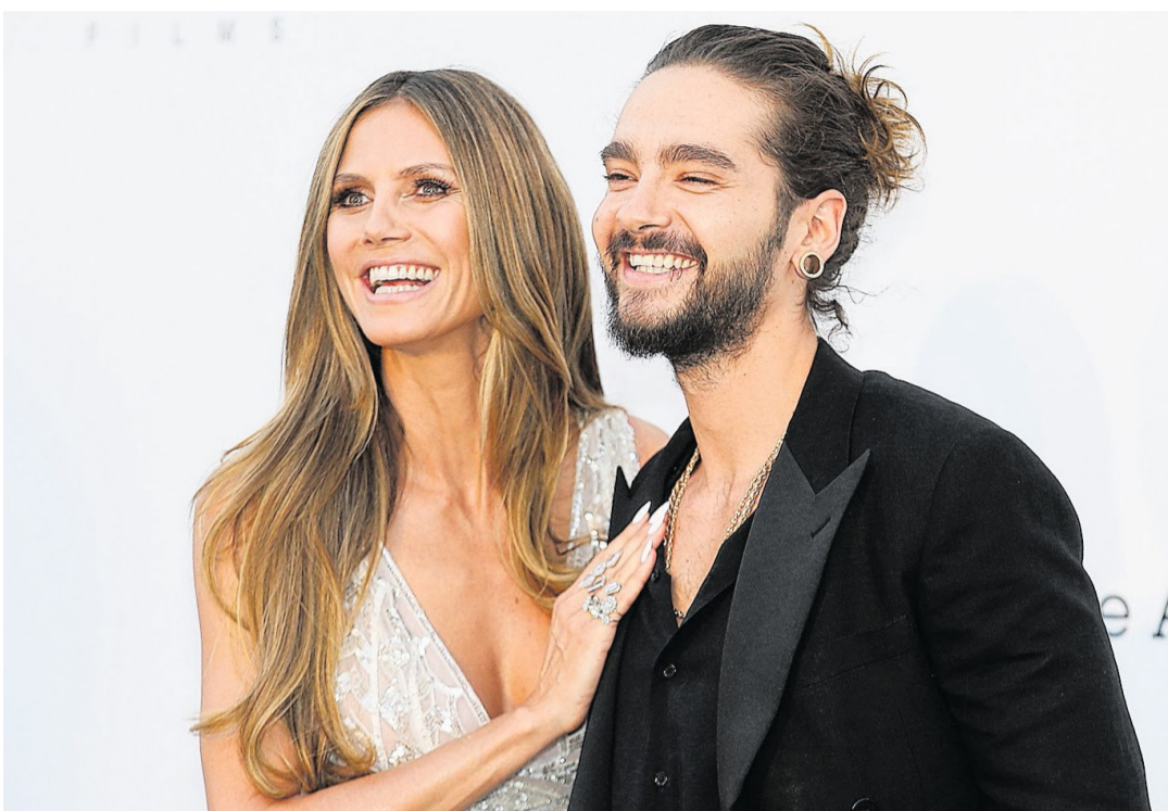
Heidi Klum ist 16 Jahre älter als ihr Ehemann Tom Kaulitz.