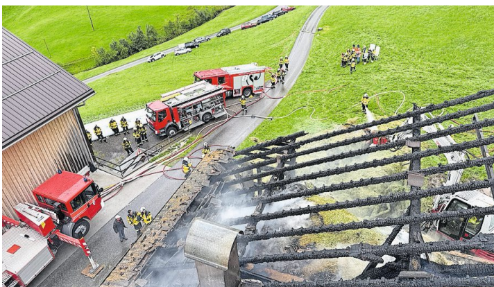
Die Feuerwehr am Einsatzort in Gonten.

Glücklicherweise befanden sich keine Tiere im Stall. Der Feuerwehr gelang es, ein angrenzendes Wohnhaus erfolgreich zu schützen. Personen und